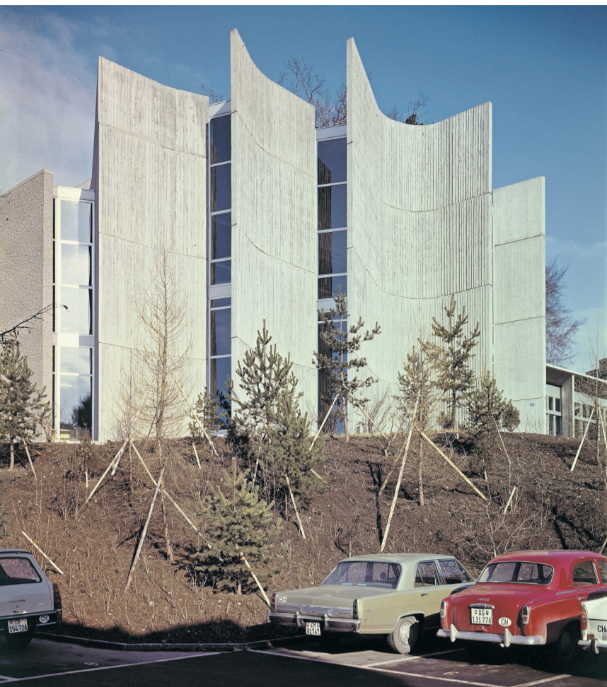
Kantonsschule Rämibühl (1970): Architektonisches Meisterwerk.