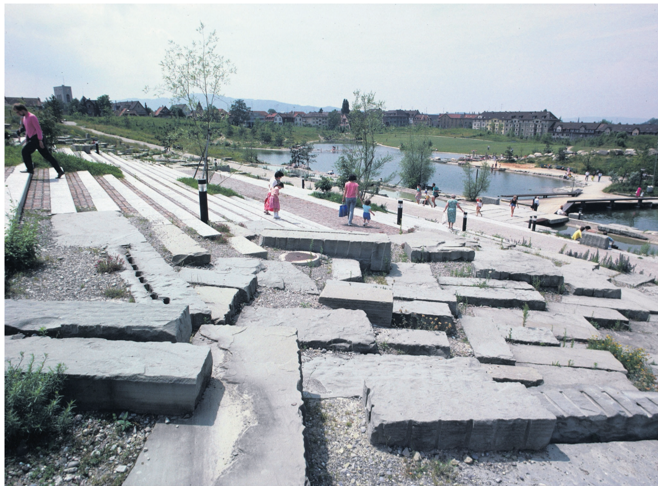
Der Irchelpark in Zürich (1986): Biotope sind Lebensraum für Menschen, Pflanzen und Tiere.